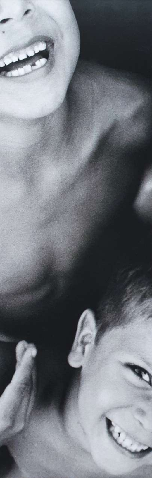
PEDRO CUNHA Simplesmente, 2005 60 x 20cm