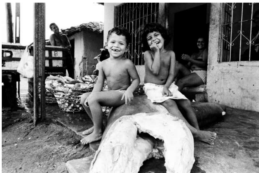
ARY SOUZA Sem Título, s/d 30 x 45cm